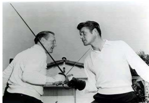
L'acteur Guy Williams, interprète de Zorro à la Télévision

Malédiction de Capistrano ( The Curse of Capistrano ) dans lequel Zorro apparaît pour la première fois. Dès 1920 le cinéma muet s'empare du personnage dans The Mask of Zorro . De nombreuses autres adaptations cinématographiques verront le jour au fil des années.