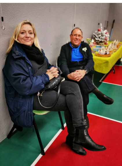
Un moment toujours fort dans l'année où il fait bon se retrouver ensemble.