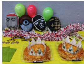
Un grand moment de convivialité !