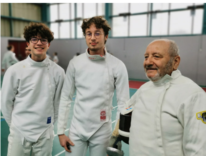
Maîtres d'armes, tireurs, parents, bureau et vainqueurs, le sourire était sur toutes les lèvres.