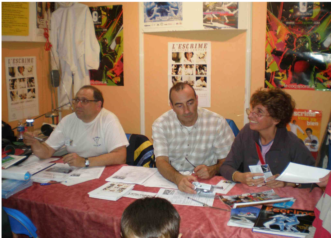
STAND DU CLUB APRES MIDI