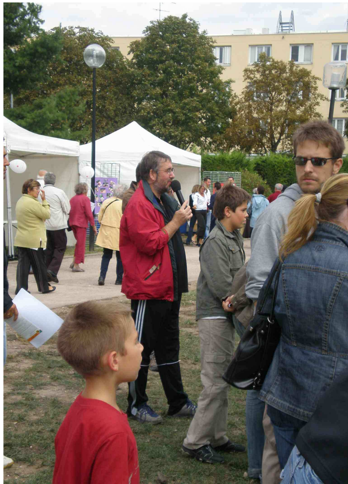
EXPLICATIONS DU MAITRE D'ARMES