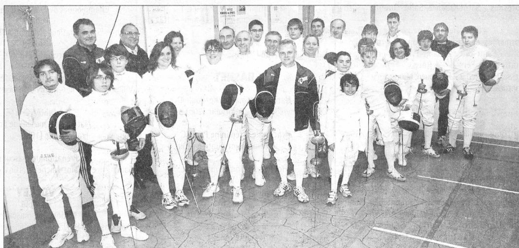
■ Une partie des 105 licenciés du club d'escrime d'Herblay.

aux régionaux benjamins», souligne le président herblaysien. Seule ombre à ce tableau idyllique : le manque de confort et de place dans la salle du COSEC de l'Orme-Macaire. «On fait appel à notre imagination et à la débrouille pour satisfaire la demande de nos adhérents.» Deux sens plus qu'aiguillés du côté d'Herblay puisque quatre pistes supplémentaires vont être créées. Avant la création d'une vraie salle d'armes... Un jour, peut-être... J.D.