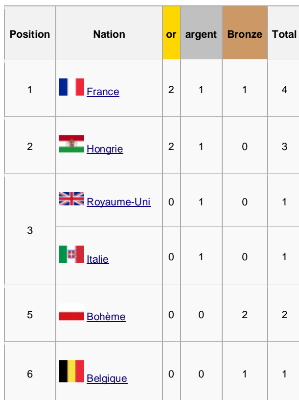
Tableau des médailles

Les épreuves d'escrime étaient au nombre de quatre : épée masculine individuelle et par équipe et sabre masculin individuel et par équipe.